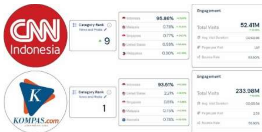
Gambar 1. 1 Analisis Data Traffic

Dikutip dari Similarweb.com, dalam kategori media dan berita CNNIndonesia.com berada diperingkat ke 9 pada Juli 2021 dengan jumlah kunjungan sebanyak 52 juta kunjungan dalam 6 bulan terakhir. Sementara Kompas.com berada diperingkat 1 dengan jumlah kunjungan sebanyak 233 juta kunjungan dalam 6 bulan terakhir 7 .