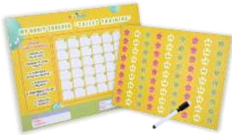
Gambar 20. Poster Habit Tracker dan Sticker