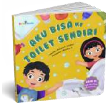
Gambar 6. Sampul Buku Depan dan Belakang

2). Sampul Buku Depan “Aku Bisa ke Toilet Sendiri”