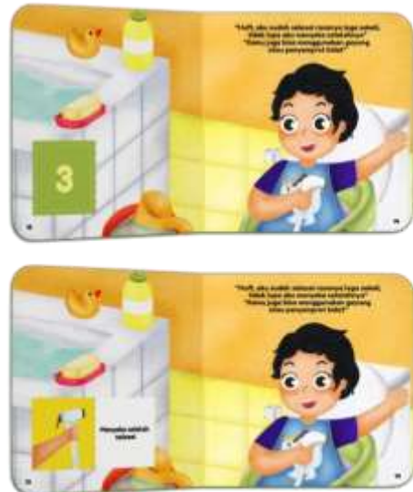
Gambar 15. Halaman 13-14