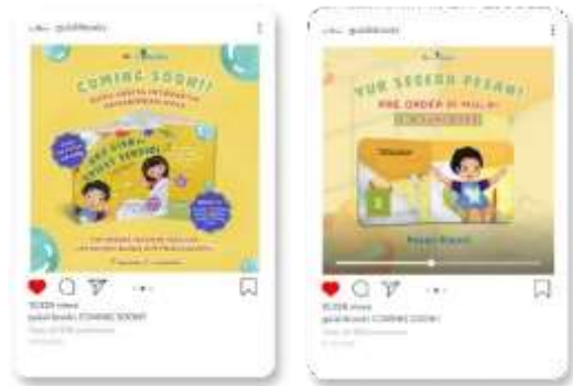
Gambar 23. Media Feeds Instagram