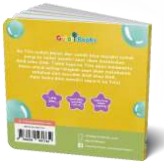
Gambar 7. Sampul Buku Belakang

3). Sampul Buku Belakang “Aku Bisa ke Toilet Sendiri”