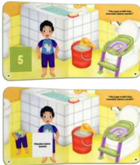
Gambar 17. Halaman 17-18