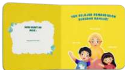
Gambar 8 Halaman Intro