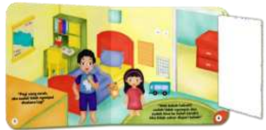
Gambar 9. Halaman 1-2