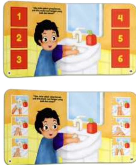
Gambar 18. Halaman 19-20