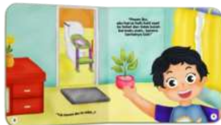
Gambar 10. Halaman 3-4