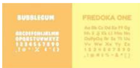
Gambar 3. Tifografi Headline & Subheadline

Tipografi adalah seni yang menyusun huruf-huruf yang digunakan sebagai metode menerjemahkan kata lisan menjadi bentuk visual tulisan dengan berbagai jenis Font . Penerapan jenis tipografi pada perancangan ini menggunakan jenis tipografi Sans Serif sesuai dengan teori tipografi untuk anak dan berdasarkan hasil survei kuesioner yang disebarakan. Penggunaan Font Bubblegum untuk Headline dan Font Fredoka One untuk bagian Subheadline isi cerita dalam buku dengan ukuran yang di butuhkan yaitu 14 sampai 24 point disesuaikan dengan jenis huruf & tingkatan usia anak.