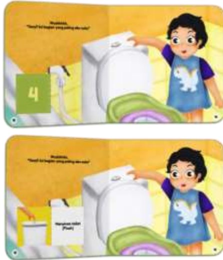
Gambar 16. Halaman 15-16