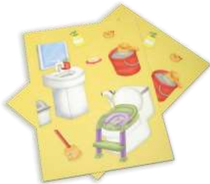
Gambar 21. Sticker