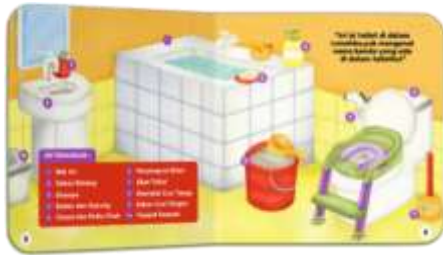
Gambar 11. Halaman 5-6