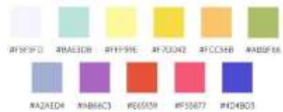
Gambar 4. Konsep Warna