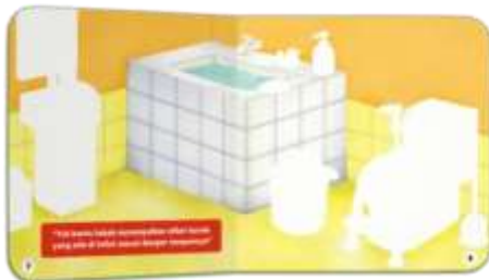
Gambar 12. Halaman 7-8