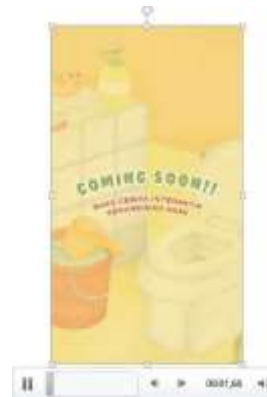
Gambar 24. Media video reels Instagram