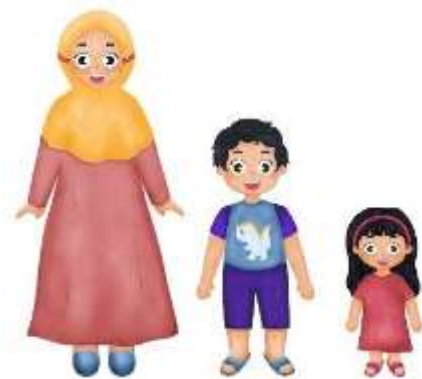
Gambar 5. Karakter Ibu, kaka dan adik