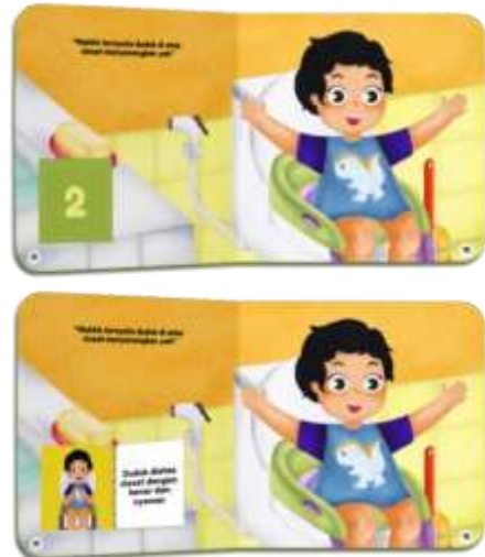
Gambar 14. Halaman 11-12