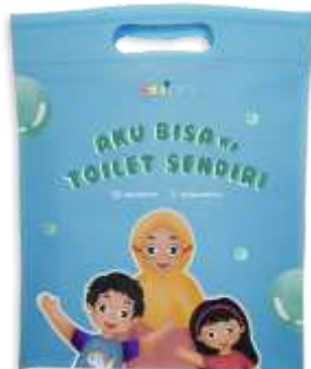
Gambar 22. Totebag