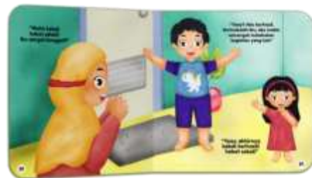
Gambar 19. Halaman 21-22