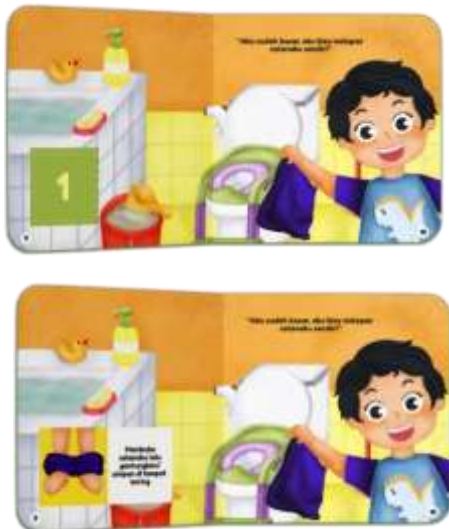
Gambar 13. Halaman 9-10