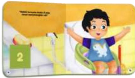
Gambar 2. Layout Buku hal 11-12