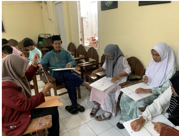
Gambar 4. Peserta Berlatih Membuat Gelang dengan Teknik Makrame

karakter individu. Pelatihan ini tidak hanya bertujuan untuk mengasah keterampilan tangan dan ketelitian, tetapi juga menumbuhkan kreativitas serta memberikan pengalaman langsung dalam menciptakan produk fesyen yang unik dan bernilai seni tinggi.