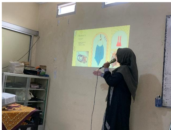
Gambar 2. Pengenalan Makrame oleh Narasumber

Narasumber yang dihadirkan dalam kegiatan pelatihan ini merupakan seorang akademisi dengan latar belakang keilmuan di bidang struktur desain. Pengalaman dan kompetensi yang dimiliki narasumber menjadikannya sangat kredibel dalam menyampaikan materi yang tidak hanya bersifat teoritis, tetapi juga aplikatif. Dengan demikian, peserta mendapatkan pemahaman yang lebih utuh, baik dari sisi estetika maupun teknis dalam praktik makrame. Kehadiran narasumber dengan kapabilitas yang mumpuni ini diharapkan dapat meningkatkan kualitas pelatihan serta mendorong peserta untuk lebih antusias dan percaya diri dalam mengeksplorasi potensi diri melalui keterampilan makrame.