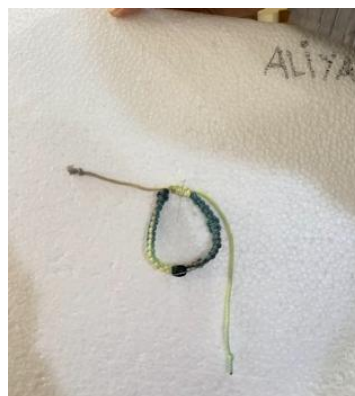
Gambar 5. Hasil Jadi Praktik Pembuatan Aksesoris Gelang dengan Teknik Makrame

Setelah proses pembuatan selesai, gelang-gelang yang telah dirangkai oleh peserta dilepaskan secara hati-hati dari alas styrofoam. Hasil akhir dari karya para peserta menunjukkan pencapaian yang sangat baik. Secara keseluruhan, peserta mampu menerapkan teknik makrame dengan tepat, mulai dari pengikatan simpul dasar hingga pembentukan pola yang rapi dan estetis. Gelang yang dihasilkan tidak hanya berhasil terbentuk sesuai dengan instruksi, tetapi juga menunjukkan kreativitas peserta dalam memilih kombinasi warna dan kerapian simpul, sehingga menghasilkan karya yang layak pakai sebagai aksesoris fesyen. Hal ini menjadi indikator bahwa materi yang disampaikan dapat dipahami dan diimplementasikan dengan baik oleh seluruh peserta. Selain itu, kualitas hasil karya menunjukkan bahwa peserta memiliki ketekunan, koordinasi motorik halus yang baik, serta kemampuan mengikuti arahan secara detail, yang merupakan keterampilan penting dalam kegiatan kerajinan tangan seperti makrame.