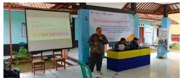
Gambar 2. Kegiatan Pelaksanaan

Kegiatan Pengabdian kepada Masyarakat (PKM) dengan tema 'Teknologi Kecerdasan Buatan (AI) dalam Kehidupan Sehari-hari' yang diselenggarakan di Desa Tunggilis pada tanggal 22 Juli 2025 telah berhasil mencapai tujuannya, yaitu meningkatkan literasi digital masyarakat dan memberikan pemahaman yang lebih baik tentang konsep AI serta aplikasinya dalam kehidupan sehari-hari. Selama kegiatan, beberapa hasil signifikan tercatat, termasuk peningkatan pemahaman teknologi, tingkat partisipasi, dan kesadaran etika digital.