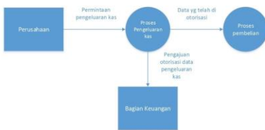
Diagram arus data dari proses Pengeluaran kas