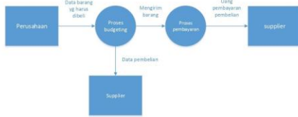
Diagram arus data dari proses Pembelian