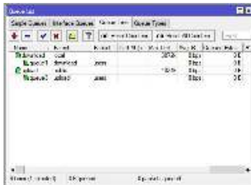
Gambar 2 Queue Tree