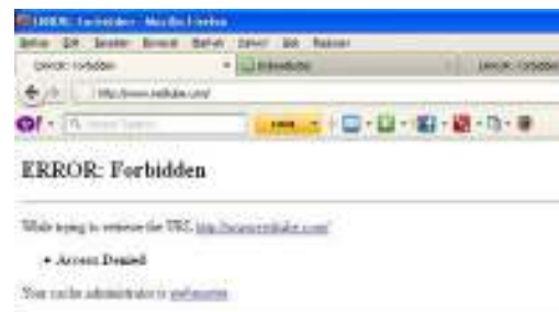
Gambar 3 Situs Block

Berikut adalah pengujian yang telah dilakukan untuk mengetahui situs yang dikonfigurasi telah berhasil diblok pada web browser: