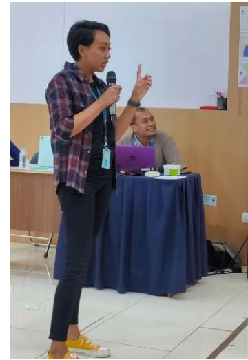
Gambar 4. Pemaparan Materi

Peserta diajak untuk melakukan refleksi dengan metode role play terpadu tentang pemaknaan suatu perjalanan dalam organisasi. Mahasiswa diminta untuk menyadari mengenai apa yang menjadi kekurangan mereka dan rekan dalam satu organisasinya serta memaknai mengenai organisasi. Pada sesi terakhir anggota EXCMA di minta untuk menyatakan hasil dari role play yang telah dilakukan serta membuat perencanaan mengenai kaderisasi pengurusan di tahun berikutnya berdasarkan hasil yang diperoleh dari role play dan refleksi diri dari anggota team sebagai acuan bagi pengurus saat ini dalam membuat perubahan pada pengurusan yang akan datang.