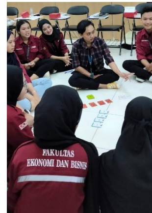
Gambar 2. Forum Group Discussion

Menumbuhkan sense of belonging , ownership dan tanggungjawab anggota excma bisa dengan lingkungan yang inklusif. Buchari (2021) Lingkungan inklusif organisasi dapat diciptakan dengan menciptakan dukungan keseimbangan kerja dan kehidupan pribadi, membuat suatu budaya atau tradisi yang dapat menciptakan rasa terikat dengan organisasinya, himpunan perlu juga memberikan dukungan pengembangan pribadi, ijin anggota untuk dapat berkreasi ditempat lain sebagai wahana untuk mengerahkan potensi potensi untuk dapat meningkatkan value himpunan, beri pengakuan dan apresiasi atas prestasi yang diraih anggota, gandeng anggota baru, perkuat budaya organisasi, menciptakan organisasi yang saling mendukung dan hargai inisiatif, bentuk otoritas dan kewenangan yang jelas untuk meminimalisir kebingungan anggota, sediakan ruang untuk inovasi, beri umpan balik yang tepat sasaran. Organisasi yang terbuka dan nyaman akan menciptakan efektivitas individu yang baik, kepemimpinan dapat terbentuk ketika setiap anggota excma memiliki pemahaman mengenai visi, misi dan dapat memetakan jalan dalam pencapaian tujuan sehingga proses dalam kepemimpinan dapat berjalan efektif.