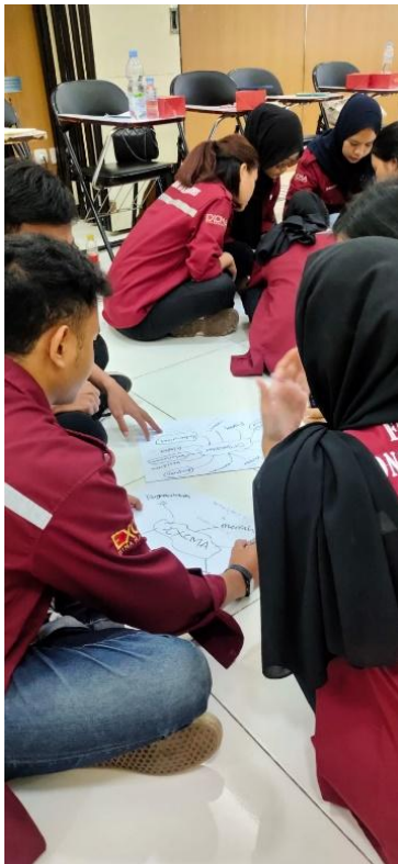
Gambar 3. Refleksi Diri melalui Role Play

mengetahui misi dari excma, namun 100% mengetahui makna dari logo excma. Pada sesi kedua setiap anggota excma diminta membuat mind map mengenai makna organisasi dan excma. Seluruh peserta dapat memahami dan memaknai dengan positif, peserta menyadari bahwa terdapat masalah dan konflik dalam menjalankan organisasi namun itu merupakan hal yang positif dan dapat menjadi perubahan bagi organisasi.