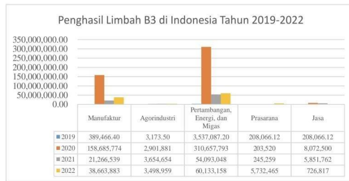
*Limbah yang dihasilkan dalam satuan ton