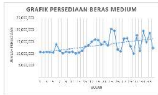
Gambar 4.1 Plot Data Persediaan Beras Medium

Perlu diketahui pola data terlebih dahulu, untuk itu dilakukan plotting data jumlah persediaan beras. Dengan bantuan Microsoft Excel 2010 diperoleh: