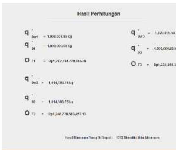
Gambar 4.6 Hasil Perhitungan Menggunakan Software Java 8

Dengan bantuan software Java 8 diperoleh hasil perhitungan seperti pada Gambar 4.6