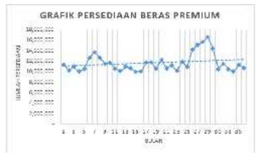
Gambar 4.2 Plot Data Persediaan Beras Premium