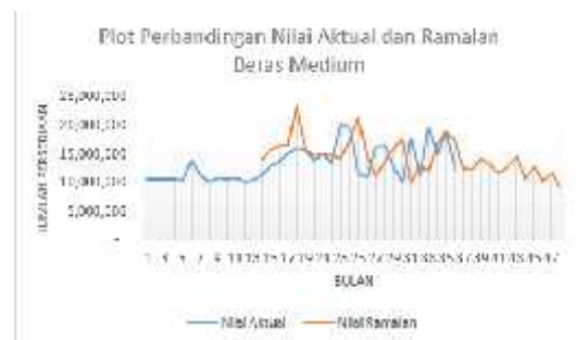
Gambar 4.3 Plot Perbandingan Data Ramalan dan Aktual Persediaan Beras Medium

Diperoleh nilai \alpha = 0,55 , \beta = 0,55 dan \gamma = 0,4 beras medium sehingga plot perbandingan hasil ramalan dapat dilihat pada Gambar 4.3.