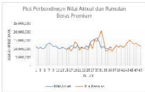
Gambar 4.4 Plot Perbandingan Data Ramalan dan Aktual Persediaan Beras Medium