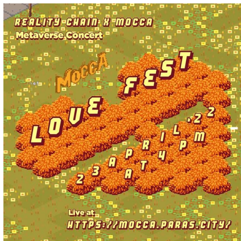
Gambar 2. Poster Love Fest Mocca

Konser Love Fest Mocca di metaverse dapat diakses secara gratis tanpa perlu membeli tiket. Pandu Sastrowardoyo, pendiri Realitychain.io, menjelaskan bahwa konser Mocca dalam metaverse disajikan secara gratis agar bisa dinikmati oleh sebanyak mungkin penonton, sambil juga meningkatkan kesadaran tentang metaverse . Dalam metaverse , personel Mocca dan penggemar mereka akan hadir dalam bentuk avatar dan bisa berinteraksi layaknya berada di sebuah konser fisik. Selain itu, penggemar juga memiliki kesempatan untuk menikmati serta mengoleksi NFT dari Mocca.