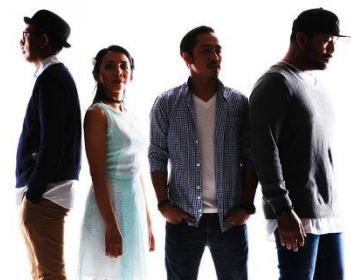
Gambar 1. Band Mocca

Grup band Mocca berkolaborasi dengan Paras Digital dan Realitychain.io untuk menghadirkan cara baru dalam mengonsumsi musik dengan menggelar konser di metaverse bertajuk Mocca Love Fest pada 23 April 2022 yang lalu. Paras Digital adalah startup yang berfokus pada pengembangan proyek Web 3.0 dalam media yang terdesentralisasi. Salah satu proyek Paras Digital adalah Paras Marketplace, merupakan pasar NFT (Non-Fungible Token) untuk barang koleksi digital. Sementara Reality Chain merupakan pemenang penghargaan Metaverse Sosial yang berusaha memberi audiens pengalaman metaverse yang tidak imersif dengan pengembangan Web 3.0. Menurut Reality Chain, metaverse seharusnya tidak menggantikan interaksi sosial audiens dan sebaliknya, metaverse seharusnya menjadi bagian yang melengkapi kehidupan sosial audiens. Metaverse dari Reality Chain memberikan pengalaman lingkungan virtual juga memberi pengalaman dengan memiliki bagian-bagiannya sebagai NFT.