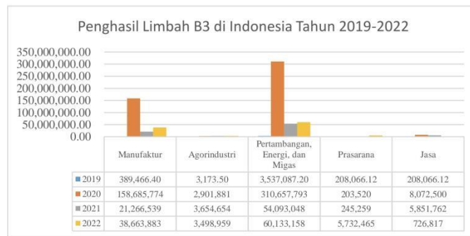
*Limbah yang dihasilkan dalam satuan ton Sumber: Kementerian Lingkungan Hidup dan Kehutanan, 2023 (Data diolah penulis, 2024).